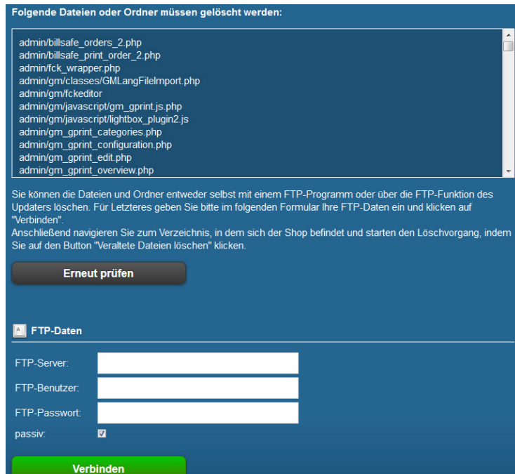
Abbildung 4: Löschen von veralteten Dateien