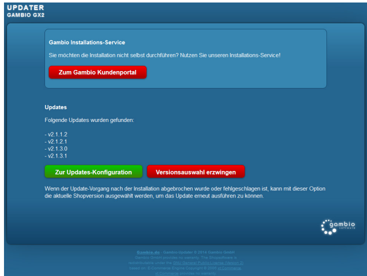
Abbildung 2: Anzeige der verfügbaren Updates nach Einloggen mit den Admin-Daten